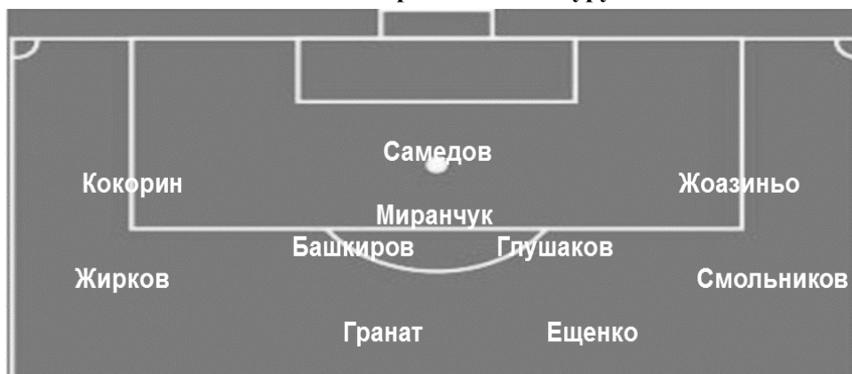
Рис. 1. Схематическое расположение наилучшего варианта сборной России по футболу в 2016 году Fig. 1. The best schematic location of the Russia national football team in 2016