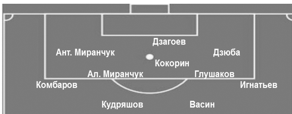
Рис. 2. Схематическое расположение сборной России на матч с Саудовской Аравией Fig. 2. Schematic location of the Russia national team for the match with Saudi Arabia

Самые востребованные по единоборствам в этом матче – Ан. Миранчук (43) и Ал. Миранчук (39). Алгоритм рекомендует половину