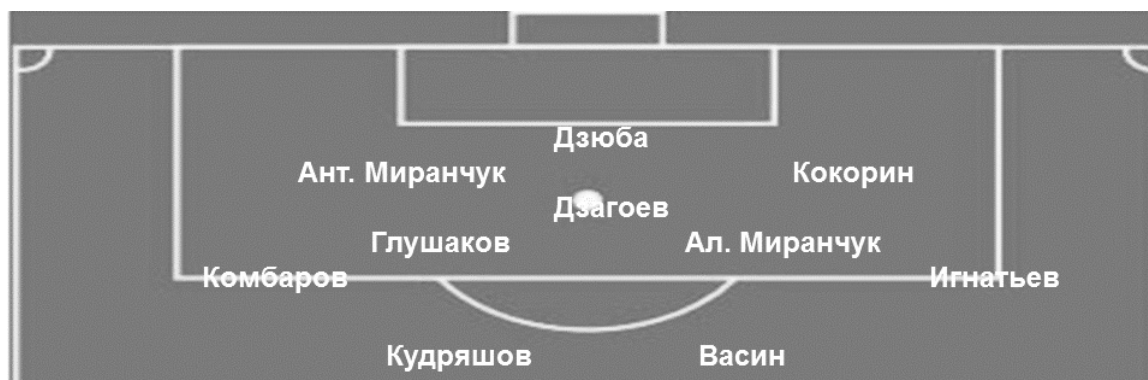
Рис. 3. Схематическое расположение сборной России на матч с Португалией Fig. 3. Schematic location of the Russia national team for the match with Portugal