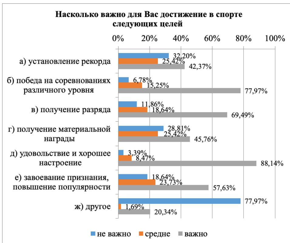
Рис. 1. Цели, преследуемые в спорте студентами спортивного вуза Fig. 1. Reasons for practicing physical activities among physical education students

ски все студенты отрицают влияние на свои занятия физкультурой такого фактора, как мода.